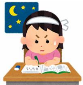
周囲に邪魔はない

では、解決策をお教えします。それは環境です。先程の“学力・学習状況調査結果”から、点数の高いお子さんの家には、本（雑誌やマンガを除く）がたくさんあり、反対に、点数の低いお子さんの保護者は、スポーツ新聞や女性週刊誌を読んだり、バラエティ番組を見ている時間が長いよう