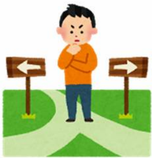
頭と心 どっちを選ぶ？

自ら勉強しない生徒に、勉強する理由を聞くと「将来、必要だから」、「私立高校はお金がかかるから」と返答します。頭では理解しています。しかし、行動しません。その理由は頭と心が一致していないから。これは、大人でも当てはまります。飲み会で「お酒を飲みすぎると身体に悪いよね。でも、もう一杯！」と言う方をたまに見かけますよね。