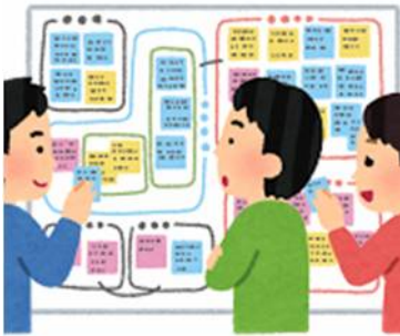
①文章を整理する方法