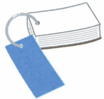
③用語を覚える方法